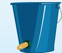
Bland i lunken melk